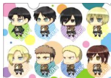
クリアポケットB ちみキャラ

※クリアポケットは数量に限りがあります。キャンペーン実施店舗ごとに在庫がなくなり次第引き換えを終了します。 ※デザインはイメージです。実物とは色や形が異なる場合がございます。予めご了承下さい。