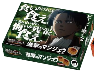
進撃のマンジュウ リヴァイ ver.