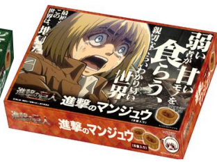
進撃のマンジュウ アルミン ver. (1/10 登場)