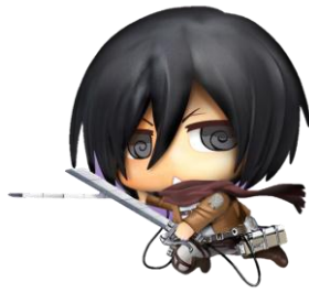
ソフビフィギュア ミカサ・アッカーマン

※フィギュア画像はイメージです。 ※フィギュアのサイズは全高約15cmです。 ※フィギュアの発送は2014年4月末を予定しております。後日、登録者様住所に直接発送させていただきます。