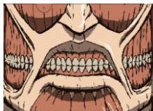
クリアポケットA 巨人