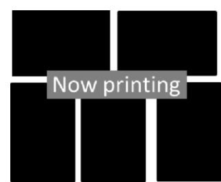
クリアファイルCセット (1/10 登場)

※1月9日（木）まではA・Bセット10種です。1月10日（金）以降はCセットの5種が追加となります。 ※クリアファイル各セットは数量に限りがあります。キャンペーン実施店舗ごとに在庫がなくなり次第、プレゼントは終了します。