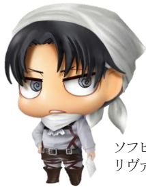
ソフビフィギュア リヴァイ兵長

モバイルキャンペーンサイトで20ポイントためるごとにソフビフィギュア1体が必ずもらえます。オプションで10ポイント追加毎にフィギュア専用スタンドがもらえます。