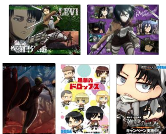
クリアファイルAセット

UFO キャッチャー500円ご利用毎にクリアファイル1枚と応募ポイント1ポイントがもらえます。 メダル貸出機で1回のご利用が2,000円以上の場合、クリアファイル5枚セットと5ポイントがもらえます。