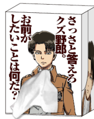
リヴァイのティッシュ