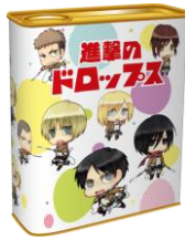
進撃のドロップス