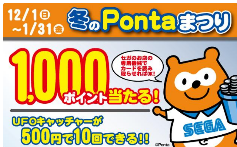
【セガ冬のPontaまつりイメージ】