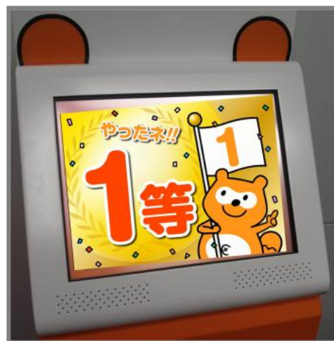
【液晶端末ルーレット画面イメージ】