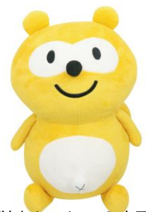
▲ 『ポンタ特大ぬいぐるみ』商品画像

開始日：2018年8月10日（金）より順次登場 料金：100円/1プレイ（30Pontaポイント/1プレイ） 景品：ポンタ特大ぬいぐるみ（約45cm） 取扱店舗： https://tempo.sega.jp/new/2018_08_ponta_02/ 著作権表記：©Ponta ©SEGA